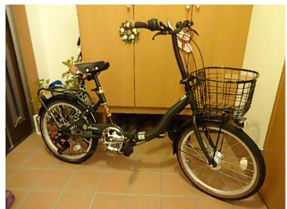
〈忘年会で当たった自転車〉