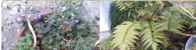
上の写真がろうばいの里