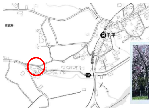
しだれ桜の開花時の写真

上南蛇井（梅沢地区）に、「姫街道のしだれ桜の里」があります。この道は、古くから中山道の裏街道として利用された「姫街道」の一部です。梅沢地区は、信州から来る荷車の通行や、旅人の休息所としての役割があったようです。4月中旬には、しだれ桜が開花すると思いますので、ぜひ足を運んでください。